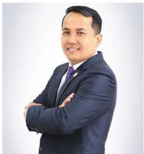
លោក នៅ វិថិកា មន្ត្រីជាន់ខ្ពស់ផ្នែកគ្រប់គ្រងហានិភ័យ និងប្រតិបត្តិការ ត្រូវបានទទួលស្គាល់ដោយធនាគារ ជាតិនៃកម្ពុជា

នៅចុងឆ្នាំ២០១៨រហូតដល់ដើមឆ្នាំ២០១៩ យើងត្រូវបានចុះត្រួតពិនិត្យពីធនាគារជាតិនៃកម្ពុជា ហើយជារួមយើងទទួលបានលទ្ធផលគួរជាទីគាប់ប្រសើរ។ នេះគឺជាទីគោល ដ៏សំខាន់មួយរបស់យើង សម្រាប់ការអភិវឌ្ឍន៍ឲ្យកាត់តែប្រសើរនៅថ្ងៃខាងមុខ។